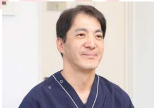
(ドクターズファイルより)

現在、待合室が混み合っているうえに飼い主様が立ってお待ちいただいていることが多く、また待ち時間も長くないへんご迷惑おかけしております。